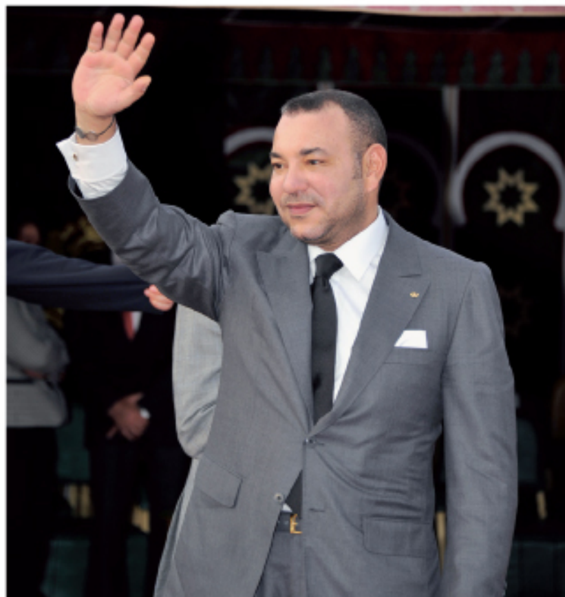
Message de S.M. le Roi Mohammed VI

Les traditions séculaires de la civilisation marocaine puisent leur essence dans le fait que les Marocains sont profondément imprégnés des valeurs de coexistence, de tolérance et de concorde entre les différentes composantes de la nation, sous l'impulsion et la direction éclairée du glorieux Trône Alaouite, dont Dieu Nous a confié la charge suprême.